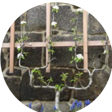
seltene Obstbäume: Spalierbirne

Das Gelände um den Sonnenstein hält aber noch andere Überraschungen bereit. Wenn ihr ganz aufmerksam seid, findet ihr auch Schätze der Natur – seltene Tiere und Pflanzen. Frag deine Eltern oder Lehrer, was die Dinge bedeuten.